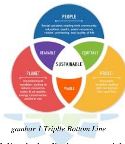
gambar 1 Triplle Bottom Line

Menurut (Mardikanto, 2018: 85) Konsep ini berangkat dari Elkington yang mengembangkan tiga komponen penting sustainable development yaitu economic growth, environmental protection dan social equality yang kemudian 3P ( profit, planet, people ) dalam karyanya Cannibals With Forks (The triple Bottom Line) yang digagas oleh The world Commission on Environment and development (WCED) dalam Bundtland Report 1987