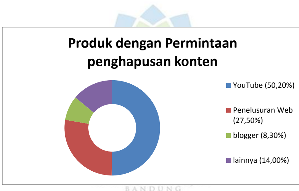
Tabel 1.3 Data Produk dengan Permintaan Penghapusan Konten

(Sumber Data: Google Laporan Transparansi.)