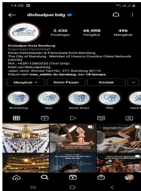
Gambar 1.1 Instagram Disbudpar

citra lembaganya serta untuk memberikan segala informasi mengenai pariwisata di Kota Bandung kepada semua masyarakat.