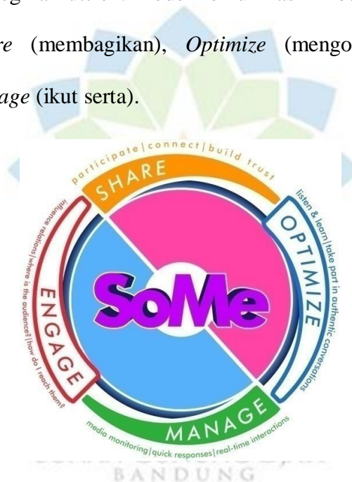
Gambar 1. 1 The Circular Model Of SoMe

Penelitian yang akan diteliti ini menggunakan model SoMe yang dikembangkan oleh Regina Luttrell. Model komunikasi ini berisi empat komponen dalam, berupa Share (membagikan), Optimize (mengoptimalkan), Manage (mengelola), dan Engage (ikut serta).