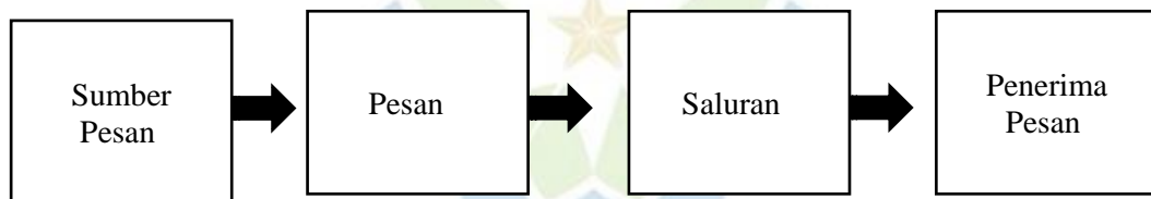
Gambar 1.1 Model Komunikasi

Sesuai yang tercantum dalam bagan di atas, sebuah model komunikasi yang bersifat linear oleh sebab aplikasi dari model Laswell ini dalam aplikasi formula penelitian komunikasinya bersifat linear , maka jika di jadikan gambar sebagai berikut: