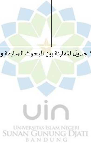
الجدول ٢.١ جدول المقارنة بين البحوث السابقة والبحث الحالي