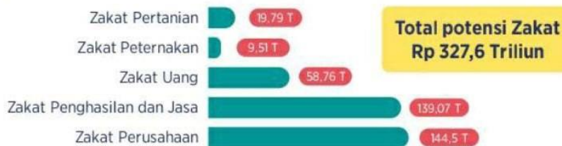
Gambar 1. 1 Potensi Zakat Indonesia