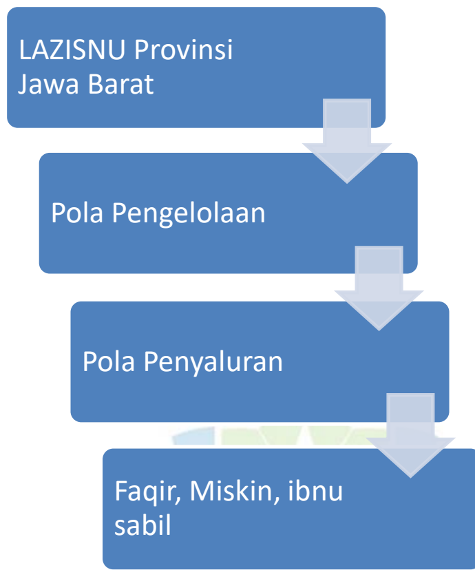
Gambar 1. 4 Kerangka Berfikir

LAZISNU Provinsi Jawa Barat adalah Lembaga Amil Zakat yang berada di bawah LAZISNU pusat yang mempunyai skala lebih kecil yaitu lingkup wilayah Provinsi Jawa Barat. Kemudian berfungsi dalam tugas mengumpulkan, mendistribusikan, dan mendayagunakan zakat sesuai dengan syariat Islam. Pola Pendistribusian zakat meliputi delapan asnaf. Kemudian pola pendayagunaan dana zakat, infak, dan sedekah meliputi konsumtif tradisional, konsumtif kreatif, dan produktif.