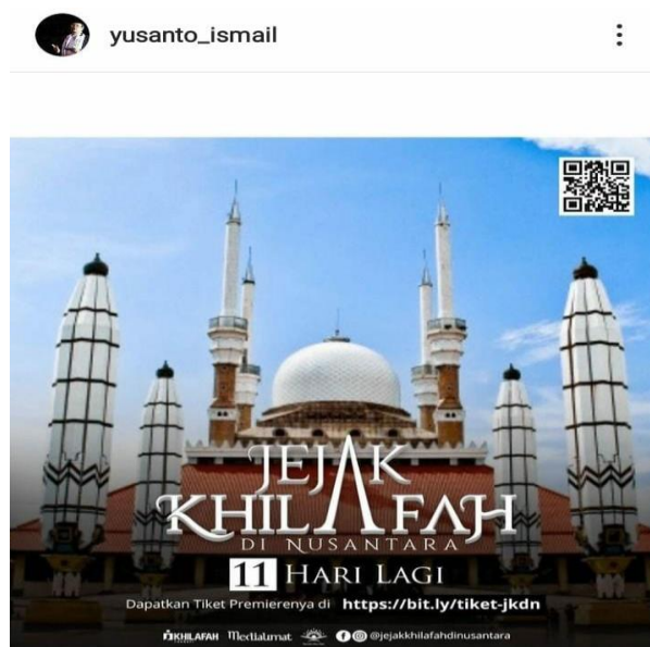
Gambar 3. Kampanye pemutaran film JKDN

Komentar pedas juga disampaikan Prof. Peter Carey sebelum penayangan film tersebut karena menurutnya film ini sengaja di desain oleh HTI untuk menyebarkan propaganda khilafah di Indonesia. Carey juga membeberkan bahwa ia pernah dicatut namanya oleh HTI secara sepihak (Ahmad, 2020). Memang, sebelum dihapus oleh HTI, cuplikan ( trailer ) film JKDN mencantumkan nama Carey sebagai salah satu sejarawan rujukan. Meski sempat menuai penolakan besar-besaran dari netizen tanah air, film ini sempat menjadi topik utama ( trending topic ) jagat maya Twitter pada rentang waktu 2020 silam.