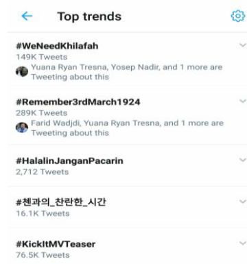
Gambar 5. Trendingnya suatu topik yang digalakkan HTI.

Tagar tersebut berisi kampanye HTI tentang pentingnya khilafah (kepemimpinan tunggal Islam) sebagai solusi untuk melindungi kaum Muslim di seluruh dunia. Selanjutnya, tagar yang menjadi trending topic dan juga didesain HTI pada tahun 2019 silam adalah #Remember3rdMarch1924 yang berisi tentang kampanye ‘mengingat kembali’ peristiwa runtuhnya kekhilafahan Utsmaniyah oleh Mustafa Kemal Attaturk tahun 1924. Peristiwa ini dianggap sebagai akhir dari kekhilafahan Islam menurut keyakinan HTI. Kedua tagar ini masing-masing dicuitkan oleh lebih dari 300 ribu orang di Twitter. Karenanya, gerilya HTI di Twitter ini dapat dikatakan berhasil karena mampu mempengaruhi opini publik untuk membicarakan kedua topik tersebut berulang-ulang dalam periode tertentu.