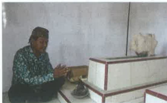
Gambar 6. Ngamulud

Pelaksanaan ritual ngabuku taun (muharaman) ini biasanya lebih ramai dan masyarakat umum dapat mengikuti prosesi ini, dari mulai ritual oleh sesepuh sampai