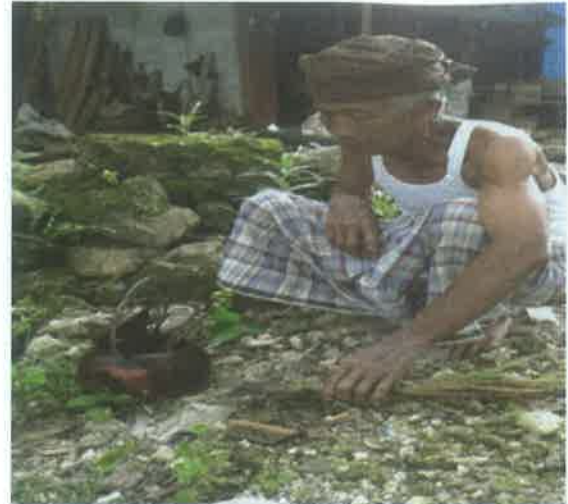
Gambar 10. Nambaan

Teko merah (tembaga), melambangkan kekuatan, air merupakan penghantar dari makhluk /pemohon/sesepuh dengan jampi-jampinya sesepuh kepada yang ngasuh diri manusia (Sang Pencipta/ Kholik ).