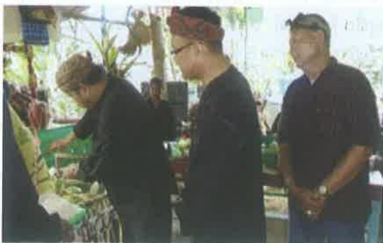
Gambar 1. Babarit

Ritual babarit biasanya dilaksanakan pada saat akibat ada gempa ( lini orang Sunda).