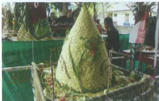
Gambar 5. Nganyaran

panen. Nganyaran artinya anyar = baru, berarti petani mulai merasakan padi/ beras yang baru.