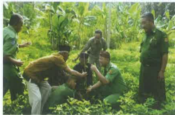
Gambar 12. Penanaman seribu pohon bersama sesepuh dan kepala desa disaksikan Camat.

Dengan demikian, pembangunan masyarakat Desa Cikalong menuju desa wisata dan budaya dalam kerangka modernitas dapat terwujud sepanjang merespon keseimbangan dualisme kepemimpinan informal (sesepuh) dan kepemimpinan formal (kepala desa).