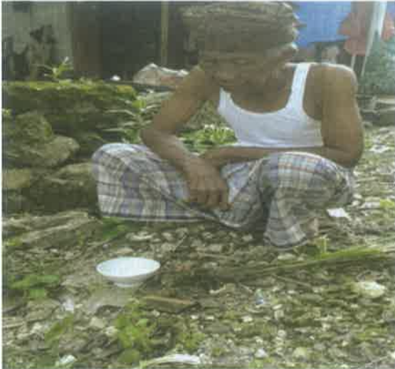
Gambar 11. Mamahanan

Jenis sesajian untuk setiap ritual biasanya terdiri dari (1) kopi pahit; (2) sejenis ketupat (istilah mereka tantang angin dan congcot ); (3) telur rebus; (4). rokok, cerutu; (5) kemenyan; (6). bubur sumsum dan; (7) sejenis rerujakan . Ketujuh jenis sesajian ini di kalangan mereka sudah biasa menyebutnya sasajen tujuh rupa .