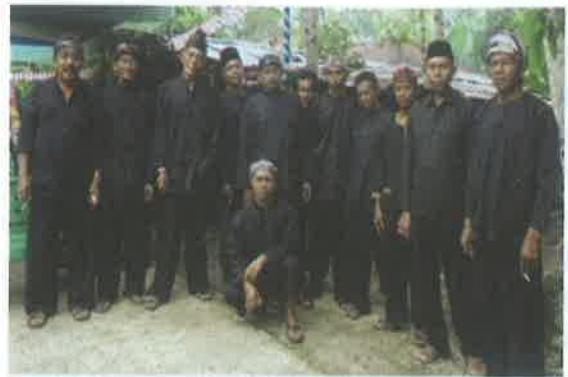
Gambar 2. Ngadegkeun

Momen hari-hari kaliwon ini, sering dimanfaatkan para penganut untuk memandikan bayi umur di bawah lima tahun (BALITA). Paling istimewa adalah ketika malam Jum'at Keliwon .