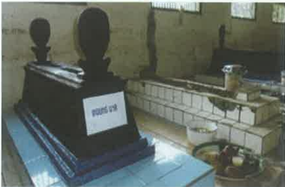
Gambar 9. Nyapu

Ritual nyapu ini selain dilaksanakan juga ketika akan ada hajatan sepitan , atau hajatan lainnya.