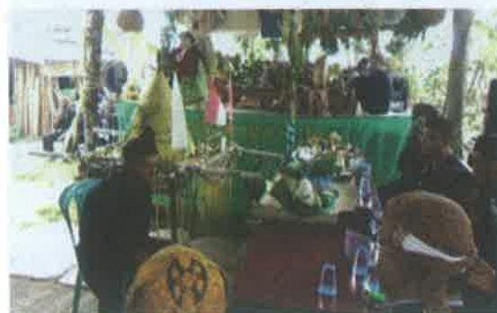
Gambar 7. Ngabuku taun

Ritual ini dilaksanakan pada setiap bulan Muharram , yang waktu serta tempatnya sangat ditentukan oleh sesepuh.