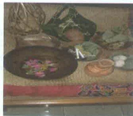
Gambar 4. Nyanggar

Ritual musiman ini dilaksanakan ketika akan panen dengan menyuguhkan sesaji yang disimpan di sawah yang akan dipanen.