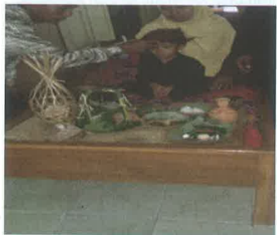
Gambar 3. Kaliwonan