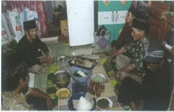
Gambar 8. Sasajen (Sidekah)

Ritual nyapu ini selain dilaksanakan juga ketika akan ada hajatan sepitan , atau hajatan lainnya.