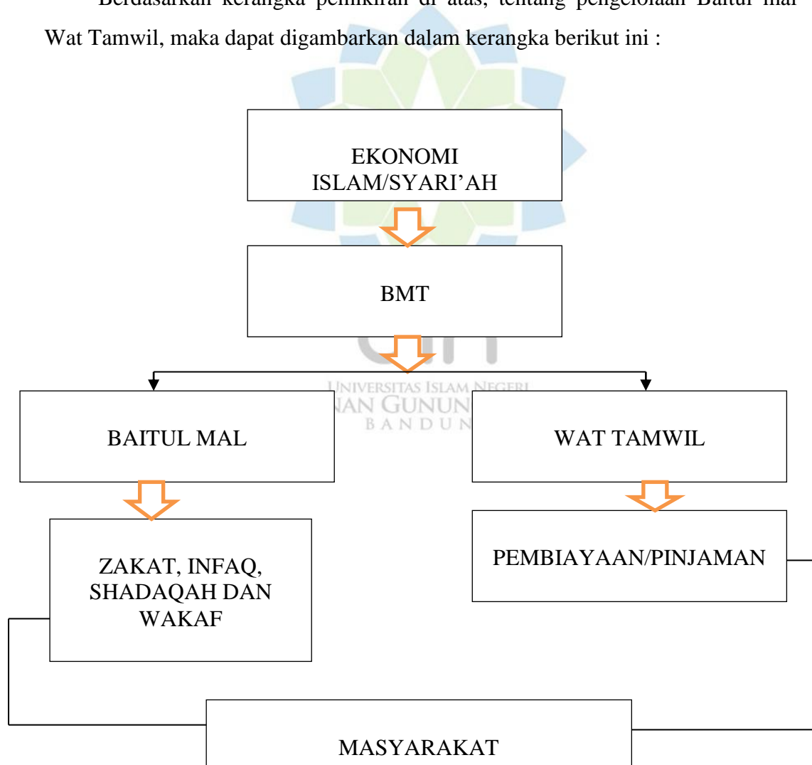
Gambar I.2 Kerangka berpikir

Berdasarkan kerangka pemikiran di atas, tentang pengelolaan Baitul mal Wat Tamwil, maka dapat digambarkan dalam kerangka berikut ini :