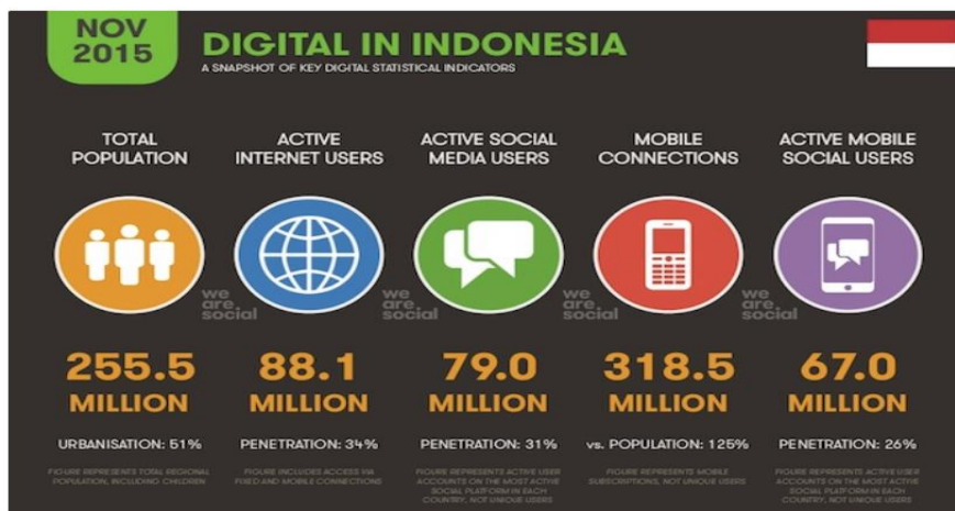
Grafik 3. Pengguna Internet di Indonesia Tahun 2015