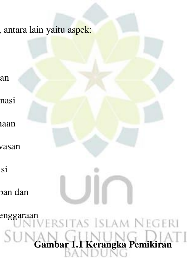
Gambar 1.1 Kerangka Pemikiran