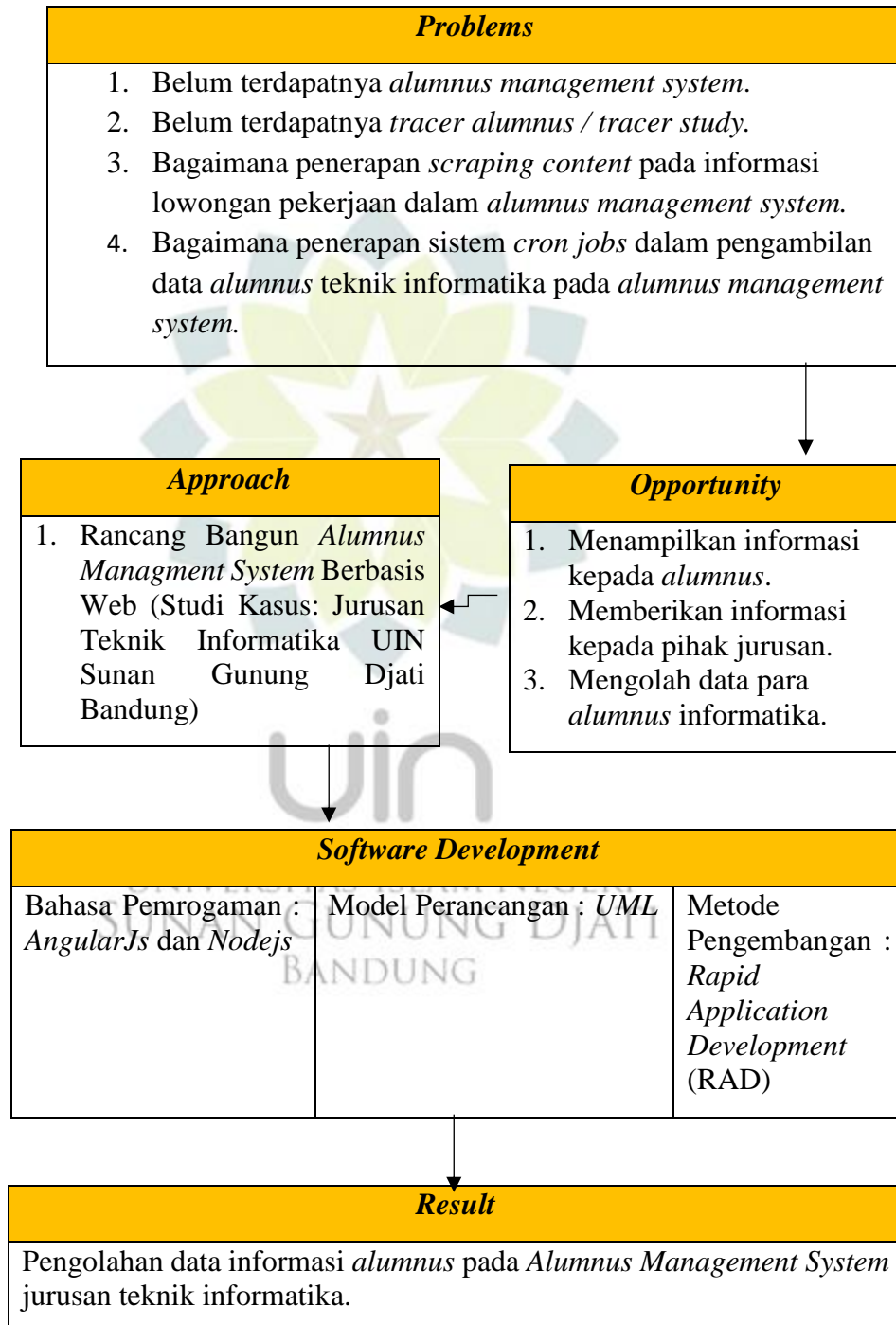
Tabel 1.1 Kerangka Pemikiran

Adapun kerangka pemikiran dari Alumnus Managemen System yang telah di gambarkan.